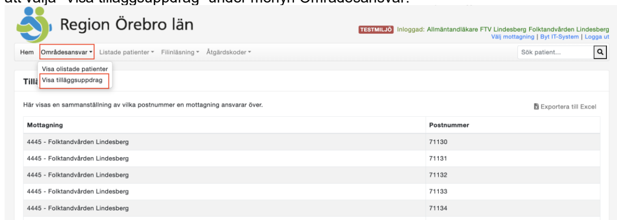
Figur 1: Visa tilläggsuppdrag

Du kan se vilka basområden som din mottagning ansvarar för enligt tilläggsuppdrag genom att välja "Visa tilläggsuppdrag" under menyn Områdesansvar: