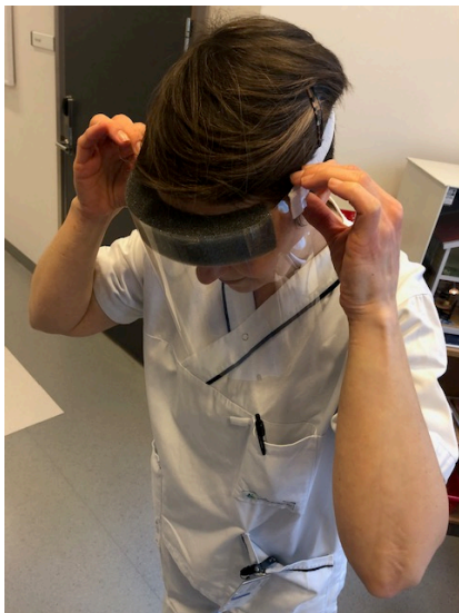
Ta av visiret bakifrån.