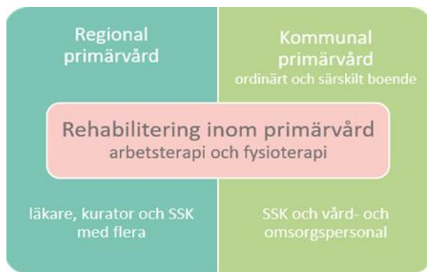
Figur 1: Ansvarsfördelning för primärvård i Örebro län

Ansvaret för rehabilitering på primärvårdsnivå reglerades genom att alla arbetsterapeuter anställdes i kommunerna och alla fysioterapeuter anställdes i regionen. Båda professionerna har ett vårdgivaransvar och riktat uppdrag gentemot både kommun och Region. Rehabiliteringsprofessionerna har ett gemensamt ansvar för en sammanhållen rehabiliteringskedja i primärvården.