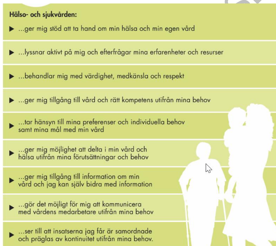
Figur 2.