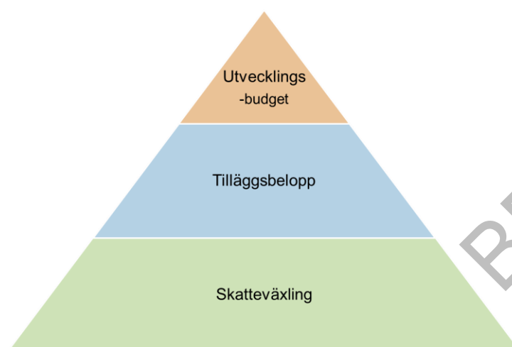
Figur 5. Modell för ekonomisk reglering mellan kommun och region

Den ekonomiska modellen baseras på samma grunder som tidigare använts med skatteväxling och tilläggsbelopp. Skatteväxlingen är oförändrad medan tilläggsbelopp uppdateras och utökas jämfört med tidigare överenskommelse. Specifika satsningar hanteras i utvecklingsbudget.